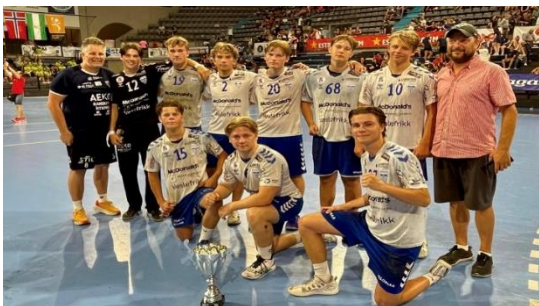
Kolbotn håndball gutter 06

Elie Hellerud, kontaktperson Vikersund håndball