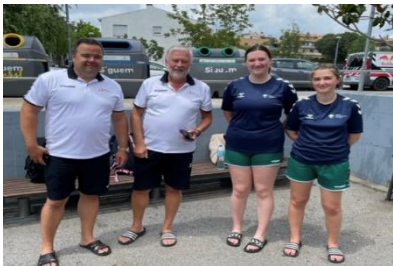
Dommere NHF Region Innlandet

Ved å benytte IØR som turoperatør, velger dere et firma registrert i Norge. IØR har stilt nødvendig garanti i Reisegarantifondet.